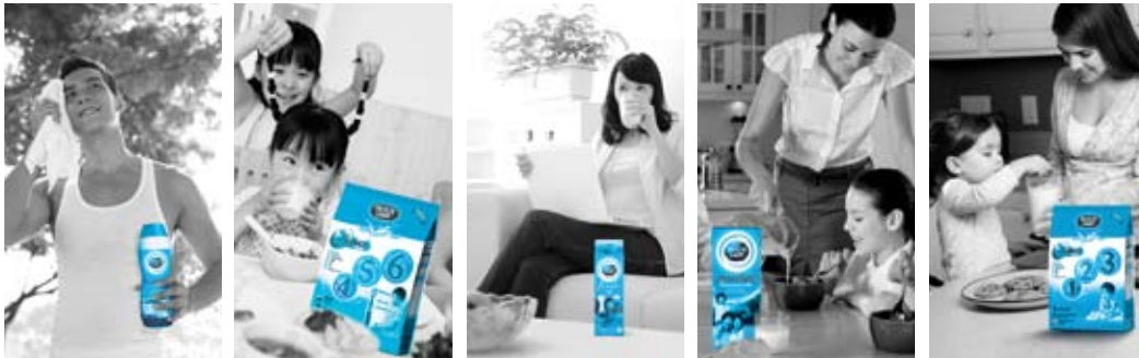
Petunjuk: 1. Susu Untuk Membesar Dutch Lady 123 dan 456 mengandungi TT-Ratio Advance™ untuk pembelajaran yang lebih berkesan. 2. Dutch Lady UHT牛奶备有两种包装,分别是250毫升及1公升。 提示: 1. 含有 TT-Ratio Advance™ 的 Dutch Lady 123 及 456 成长奶粉让学习更有效。 2. Dutch Lady UHT 牛奶备有两种包装,分别是 250 毫升及 1 公升。